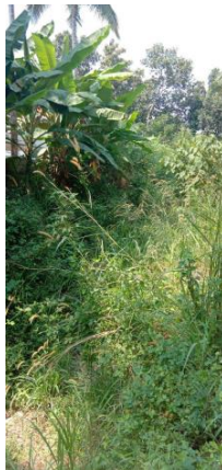
ചാനലിന്റെ ഇപ്പോഴത്തെ അവസ്ഥ